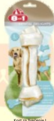
Kost za žvečenje L Art. št. 221-102687 6,30 EUR