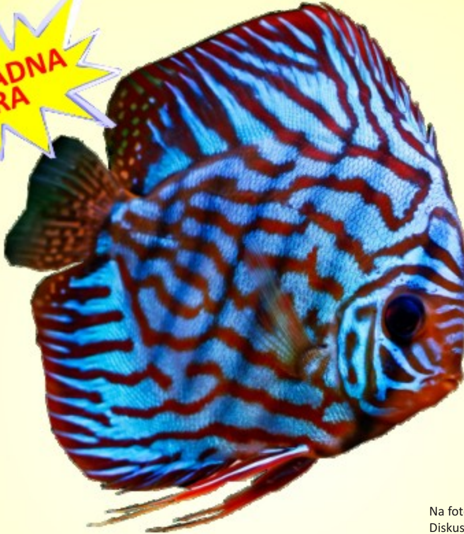
Na fotografiji: Diskus, Narcis star tri leta