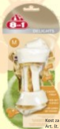
Kost za žvečenje M Art. št. 221-102434 4,60 EUR