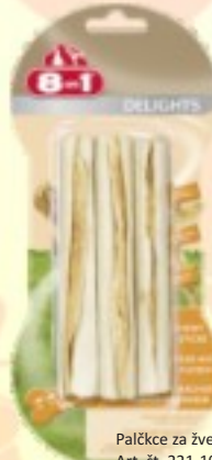
Palčke za žvečenje 3 kosi Art. št. 221-102502 5,30 EUR