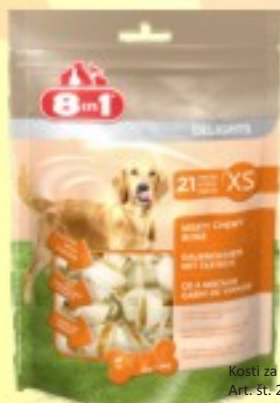
Kosti za žvečenje, 21 kosov Art. št. 221-102533 14,50 EUR

Ne vsebujejo umetnih ojačevalcev okusa, vsebujejo manj kot 2% maščob in več kot 80% beljakovin. Izberite kost, primerno velikosti vašega psa.