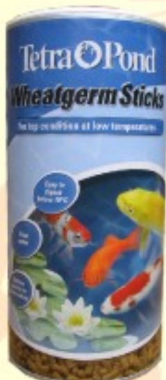
TetraPond Wheatgerm Art. št. 121-749962