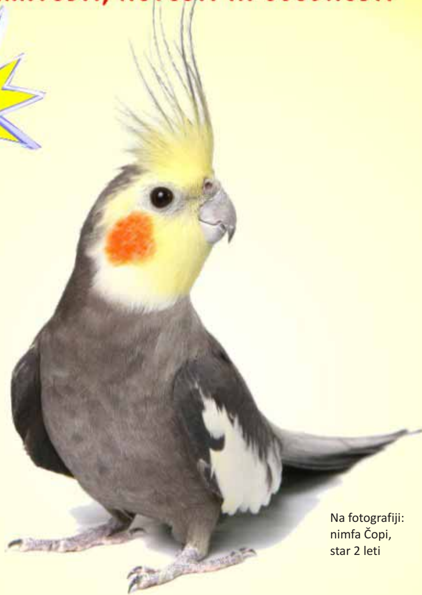
Na fotografiji: nimfa Čopi, star 2 leti