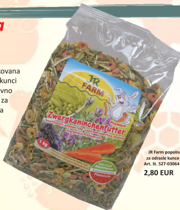
JR Farm popolna hrana za odrasle kunce Art. št. 527-03064 2,80 EUR

JR Farm Premium za odrasle kunce je popolna hrana, oblikovana posebej za pritlikave kunce in vsebuje izključno sestavine, ki jih kunci lahko optimalno porabijo. Raznolikost sestavin spodbuja naravno obnašanje kuncev ob hranjenju in zagotavlja dovolj vlaknine za glodanje, mletje in brušenje zob. Visok delež vlaknine pomaga uravnavati delovanje prebavil. Vsebuje veliko pomembnih vitaminov! Sestavine: peleti (travnata moka, pšenica), ekstrudirana koruza, peleti iz pšeničnih otrobov, vitaminski peleti (pšenica, pšenični otrobi, moka iz sončničnega ekstrakta, travnata moka, oves, sladovi kalčki), lucerna, oves, pšenica, kosmiči boba, koruzni kosmiči, koruza, k o s m i č i graha, rožiči, korenje. Brez dodanih umetnih barvil in konzervansov.