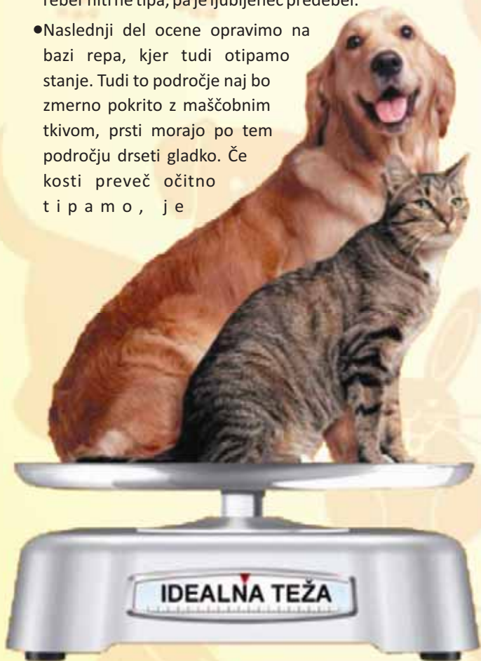
Tabela za oceno telesnega stanja

• Naslednji del ocene opravimo na bazi repa, kjer tudi otipamo stanje. Tudi to področje naj bo zmerno pokrito z maščobnim tkivom, prsti morajo po tem področju drseti gladko. Če kosti preveč očitno tipamo, je